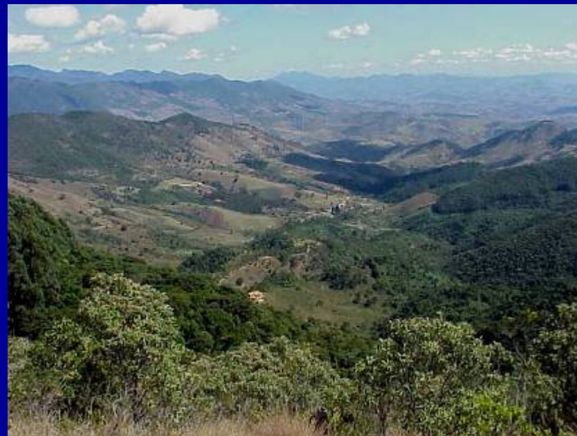
Serra da Mantiqueira