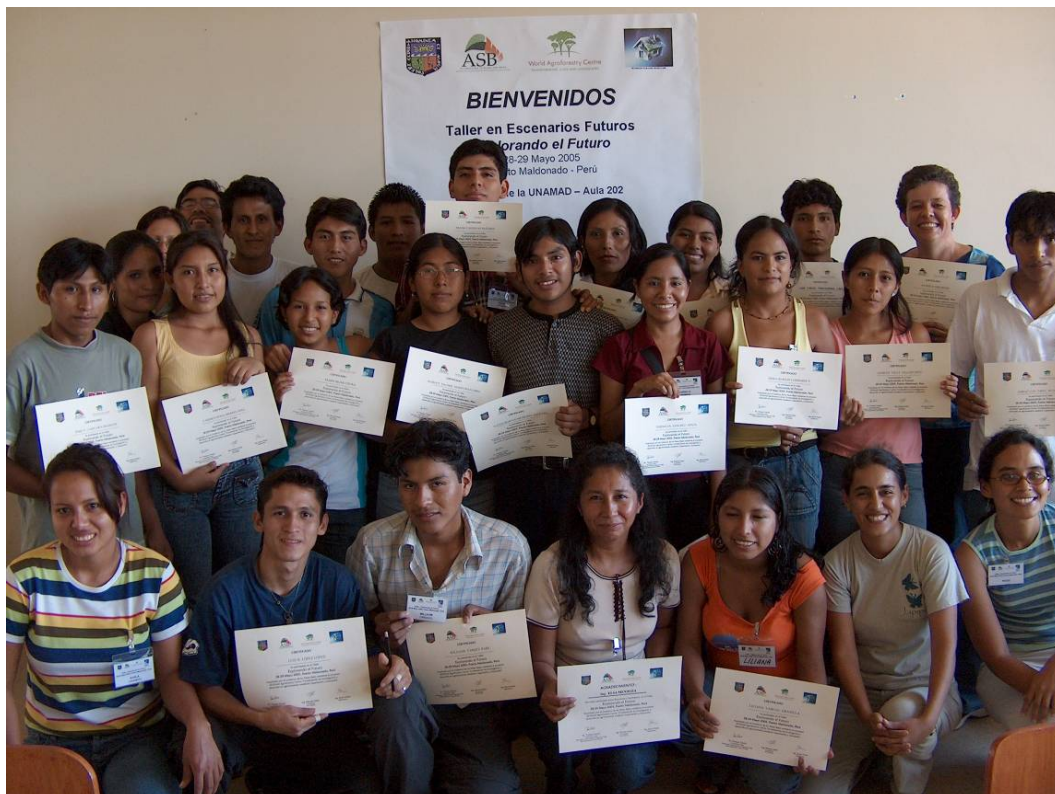
Los participantes del taller mostrando sus certificados de asistencia.