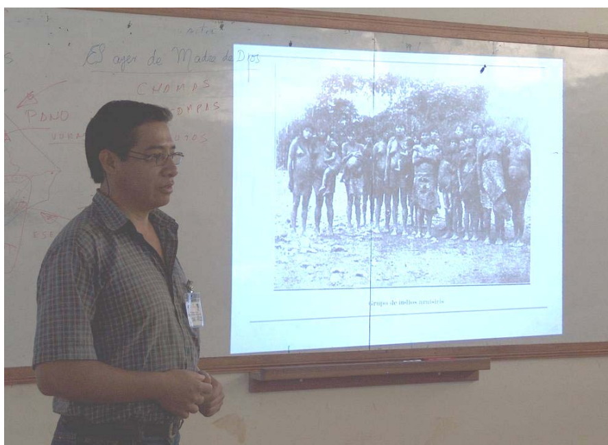
El Sr. Arzola presenta la historia de Madre de Dios.