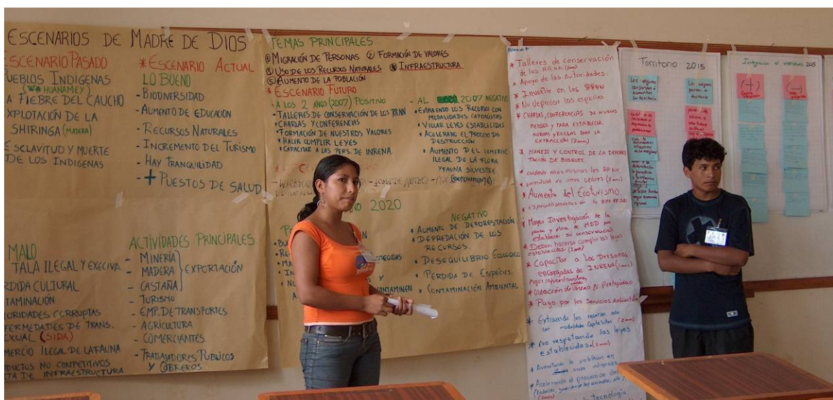
Estudiantes presentan los diferentes escenarios para Madre de Dios.