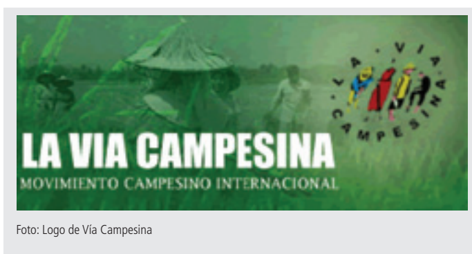
Foto: Logo de Vía Campesina