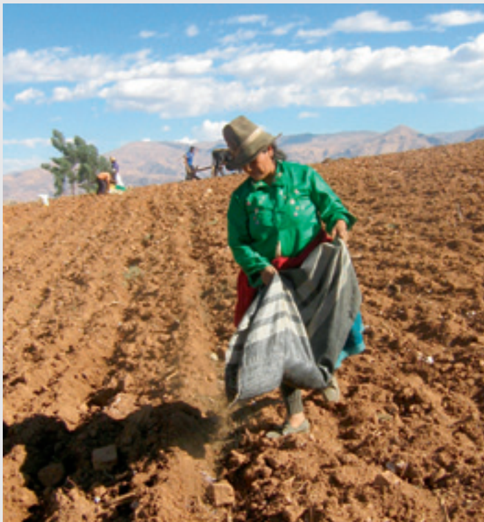
Foto: El 50% de las unidades agropecuarias del Perú, son de menos de 3 Ha., siendo el área mucho menor en la zona andina.

En relación al valor bruto de la producción agropecuaria (alimentos y bienes intermedios- insumos), el 71,5% proviene de la pequeña producción (menos de 5 Ha.).