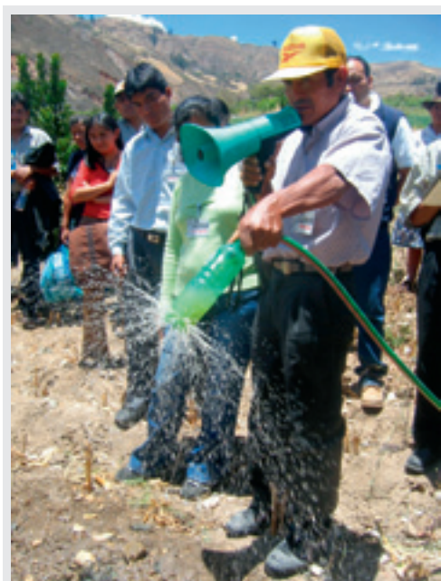
Foto: Productor rural de Ancash, Perú mostrando un sistema de riego artesanal.

Por otro lado, existe en el país un deficiente sistema de administración de riego y un bajo nivel de organización de las juntas de usuarios y comités de regantes debido a la falta de manejo de instrumentos y procedimientos técnicos y administrativos, y alta morosidad. Una de las razones de esta situación lo constituyen las reducidas tarifas por derechos de agua que pagan los usuarios, las cuales no cubren los costos de operación y mantenimiento de la infraestructura de riego, y no permiten la recuperación de las inversiones públicas en nuevas irrigaciones. Se requiere una legislación de derechos de agua más eficiente, que permita organizar un manejo integral y sostenible del agua.