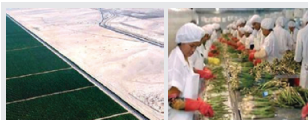
Fotos: Campos de espárrago de la empresa Agrokasa en la costa peruana. Selección de espárragos en la planta local de Agrokasa.

Así, los alimentos se han convertido en una mercancía más: el objetivo es generar ganancias, no alimentar a los pueblos. Aunque el derecho a la alimentación incluido en la Declaración Universal de los Derechos Humanos haya sido ratificado por los estados miembros de la Organización de las Naciones Unidas para la Agricultura y la Alimentación (FAO), en la Cumbre Mundial de la Alimentación, en 1996, los gobiernos optaron por aceptar las directrices de la OMC y de las instituciones financieras internacionales, que relegan a un segundo plano las necesidades alimentarias de la población.