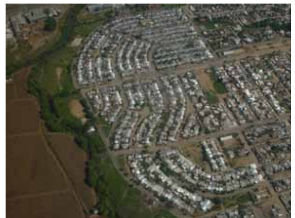
Vista aérea de la VII Región