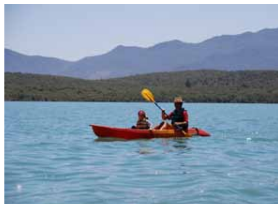
Ecoturismo en el lago Colbún

los canales de comercialización y de comunicación, y la disponibilidad de servicios básicos.