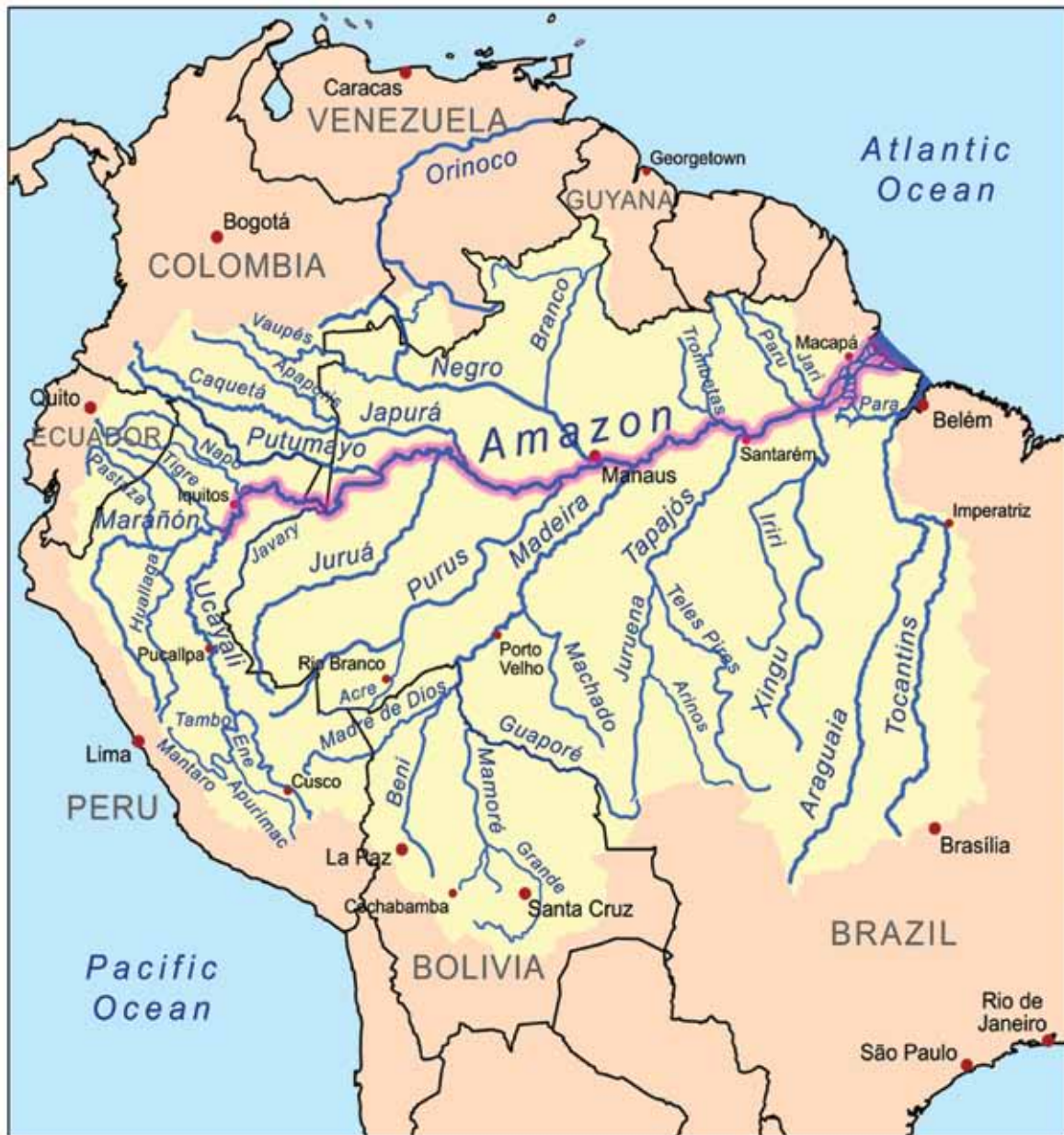
Digital Chart of the World. 2008

“ La gestión del agua por cuenca transfronteriza debe tener los elementos de buena gobernanza: participación y transparencia. ”