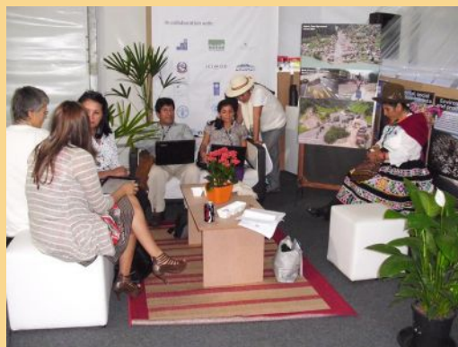
El Pabellón de Montañas, Río+20, Brasil más información en: http://pavilion.minam.gob.pe

Durante los días de la Cumbre se realizaron casi 70 eventos, incluyendo conversatorios, simposio, exhibiciones de afiches y presentaciones de videos en los diferentes espacios del Pabellón, entre el auditorio, los módulos temáticos y el salón de exhibición, y se contó con la participación de más de 40 organizaciones de 17 países.